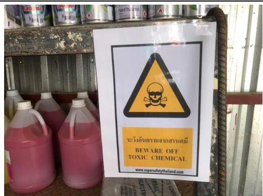
รูปที่ 50 สถานที่เก็บวัสดุไวไฟและสารเคมี