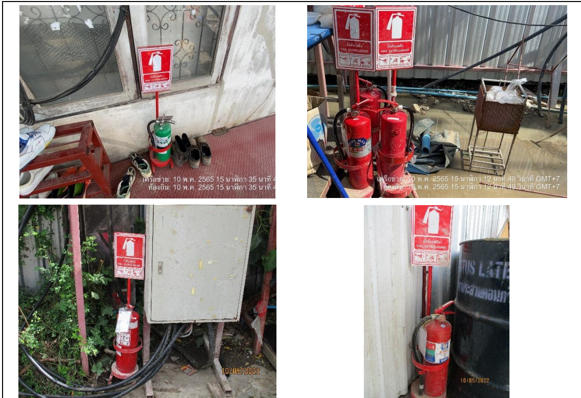
รูปที่ 28 ถังดับเพลิง