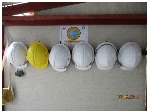
รูปที่ 45 อุปกรณ์ป้องกันอันตรายส่วนบุคคล