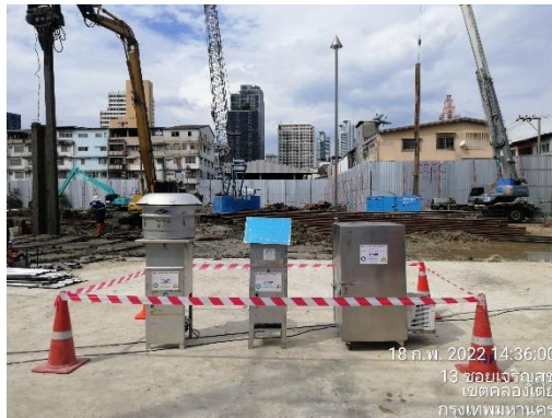
รูปที่ 24 ติดตั้งเครื่องมือตรวจวัดคุณภาพสิ่งแวดล้อม (คุณภาพอากาศ ระดับเสียง ความสั่นสะเทือน)