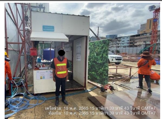
รูปที่ 17 เจ้าหน้าที่รักษาความปลอดภัย