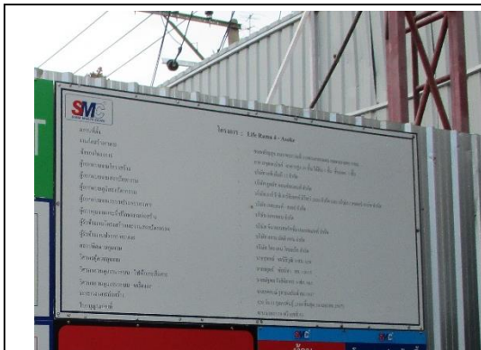
รูปที่ 1 ป้ายรายละเอียดโครงการ