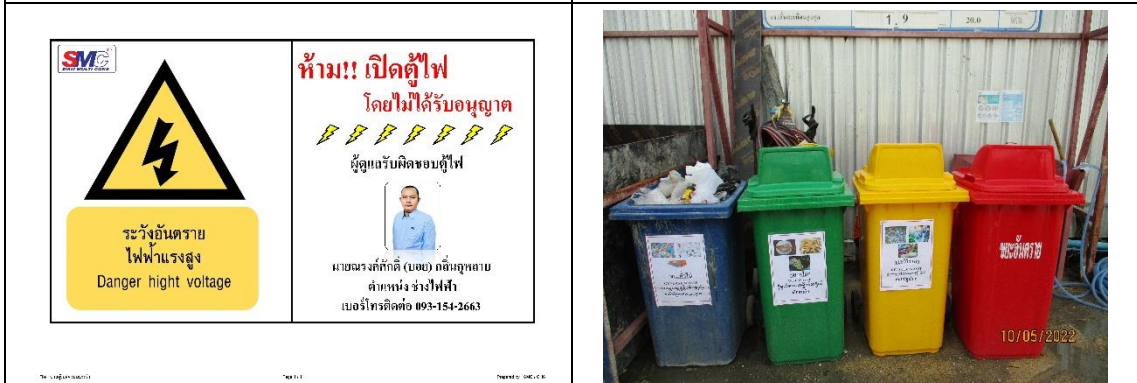
รูปที่ 31 ช่างไฟฟ้า