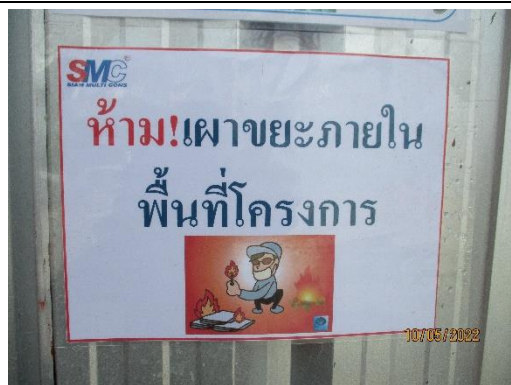
รูปที่ 16 ป้ายห้ามเผาขยะภายในพื้นที่โครงการ