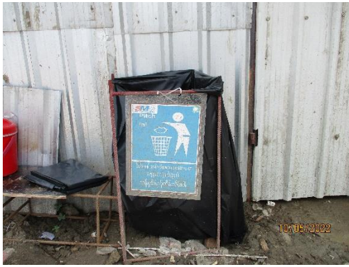
รูปที่ 33 ป้ายรณรงค์รักษาความสะอาด