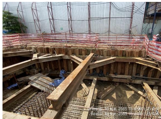
รูปที่ 20 ติดตั้ง ระบบค้ำยันและระบบป้องกันดินพังด้วย Sheet Pile