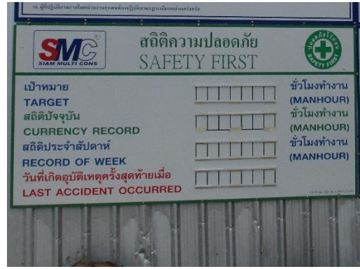
รูปที่ 34 ป้ายสถิติความปลอดภัย