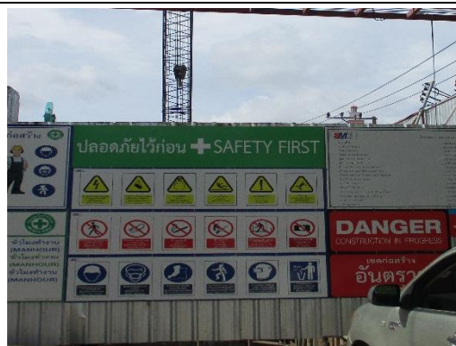
รูปที่ 3 ป้ายความปลอดภัย