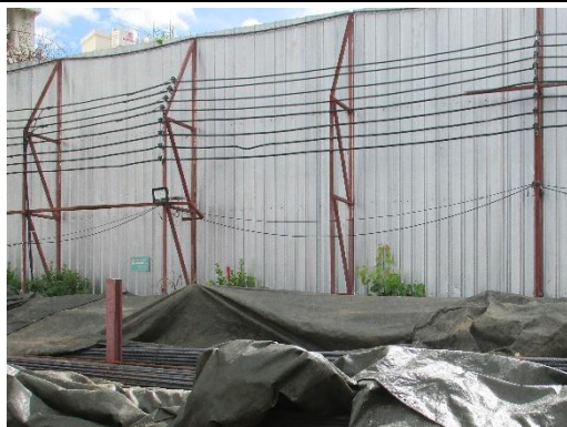
รูปที่ 14 ผ้าใบปิดคลุมวัสดุก่อสร้าง