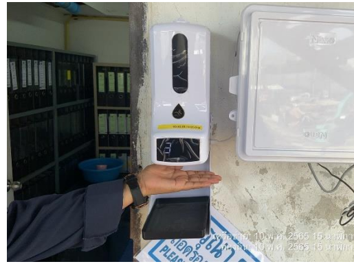
รูปที่ 41 เจลแอลกอฮอล์