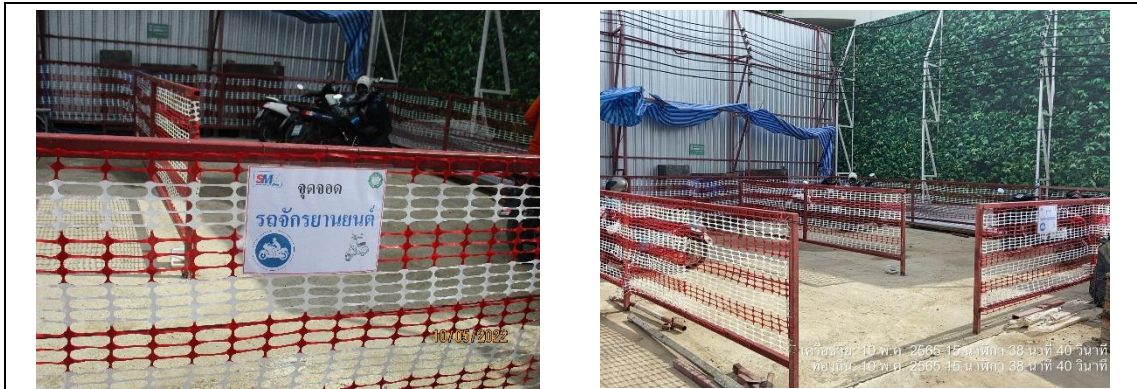
รูปที่ 11 พื้นที่จอดรถภายในโครงการ