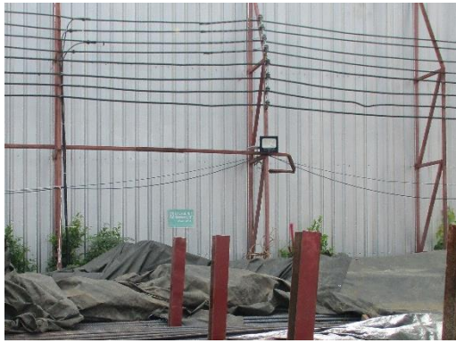
รูปที่ 13 ไฟส่องสว่าง