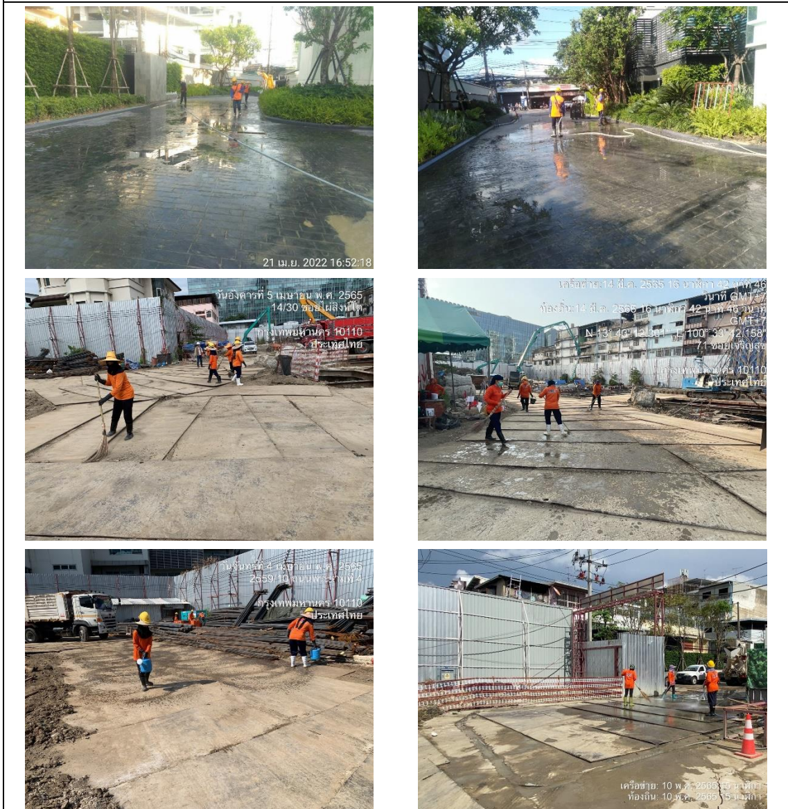
รูปที่ 12 คนงานทำความสะอาดพื้นที่โครงการ