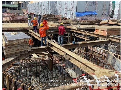
รูปที่ 47 วิศวกรควบคุมการก่อสร้าง