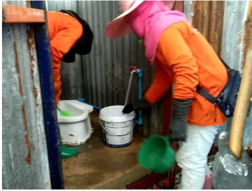
รูปที่ 22 คนงานทำความสะอาดห้องน้ำ