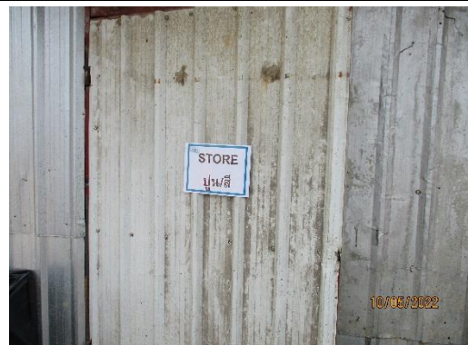
รูปที่ 21 STORE เก็บปูน