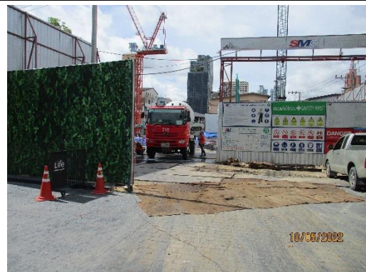
รูปที่ 10 ประตูทางเข้า-ออกโครงการ