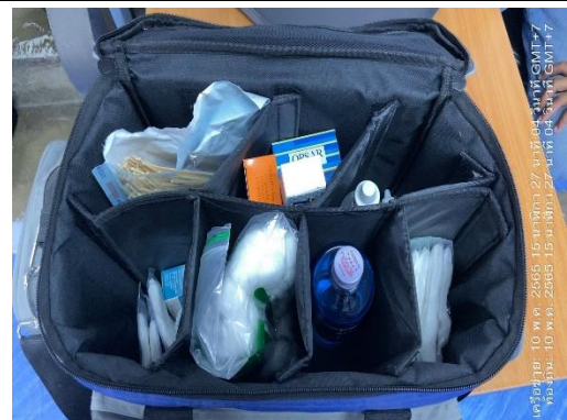
รูปที่ 27 อุปกรณ์ปฐมพยาบาลเบื้องต้น