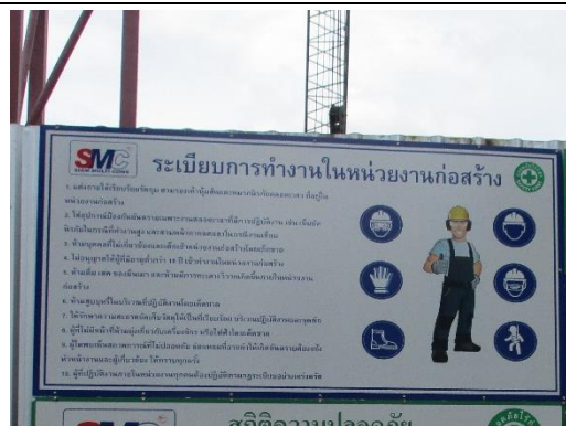
รูปที่ 4 ป้ายระเบียบการทำงานในหน่วยงานก่อสร้าง