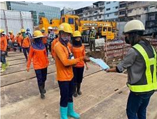
รูปที่ 42 เจ้าหน้าที่แจกหน้ากากอนามัยให้คนงาน