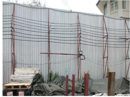
รูปที่ 7 รั้ว Metal Sheet รอบพื้นที่โครงการ