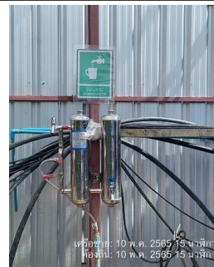
รูปที่ 46 น้ำดื่ม