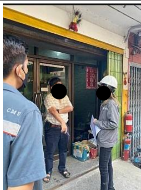
รูปที่ 18 เจ้าหน้าที่เข้าพบผู้พักอาศัยข้างเคียง