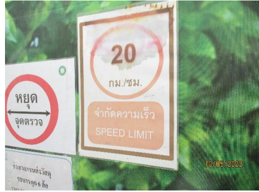
รูปที่ 23 ป้ายจำกัดความเร็ว