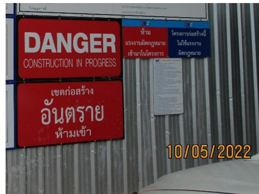
รูปที่ 2 ป้ายเขตก่อสร้างอันตรายห้ามเข้า