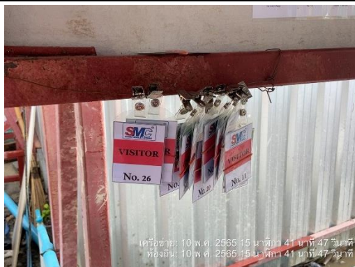
รูปที่ 48 บัตรเข้า-ออกโครงการ