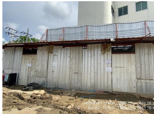
รูปที่ 36 ห้องน้ำ-ห้องส้วม