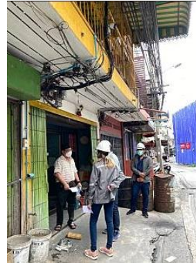
รูปที่ 18 เจ้าหน้าที่เข้าพบผู้พักอาศัยข้างเคียง (ต่อ)