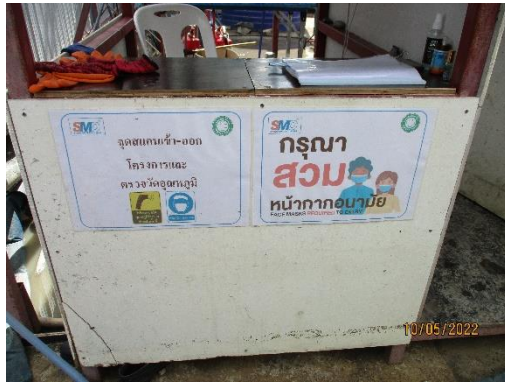
รูปที่ 40 จุดสแกนเข้า-ออกโครงการ