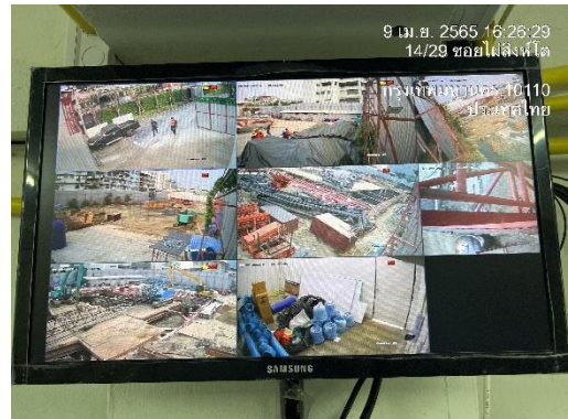
รูปที่ 19 กล้องวงจรปิด (CCTV)