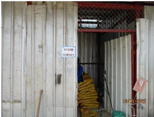
รูปที่ 35 STORE เก็บวัสดุและอุปกรณ์ก่อสร้าง