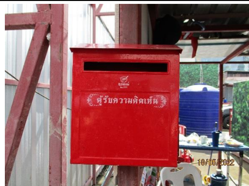
รูปที่ 6 กล่องรับความคิดเห็น