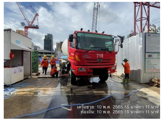
รูปที่ 9 คนงานทำความสะอาดล้างล้อรถบรรทุกก่อนออกจากโครงการ