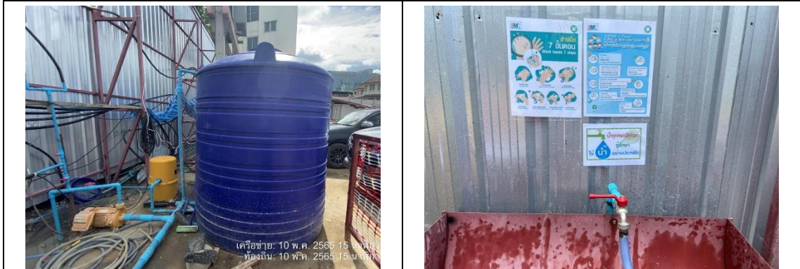
รูปที่ 29 ถังสำรองน้ำ