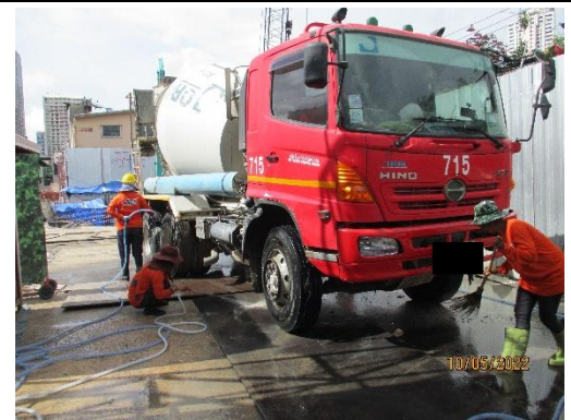
รูปที่ 15 รถผสมปูนซีเมนต์สำเร็จรูป