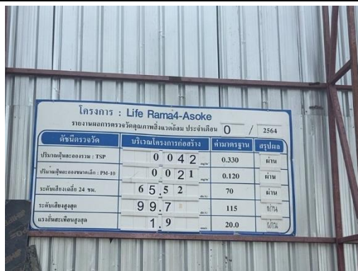
รูปที่ 5 ป้ายรายงานผลการตรวจวัดคุณภาพสิ่งแวดล้อม