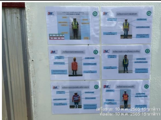
รูปที่ 49 การแต่งกายของคนงาน