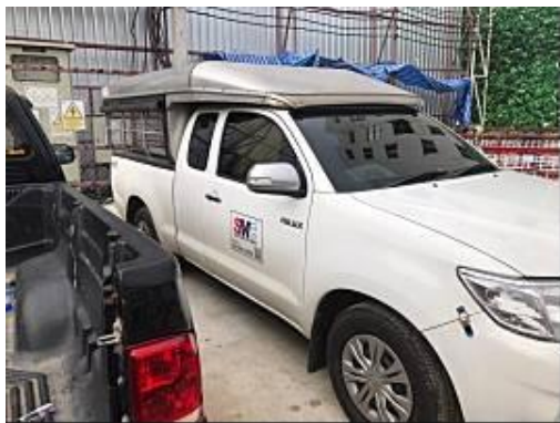
รูปที่ 43 รถรับ-ส่งคนงาน