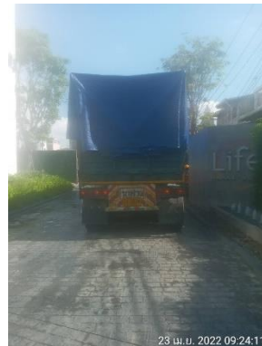
รูปที่ 8 ผ้าใบปิดคลุมท้ายรถบรรทุก